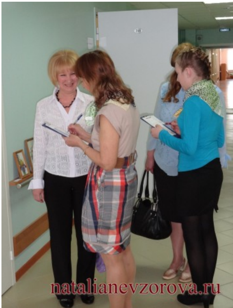
Брошюра для женщин 70+ в аптеках прежде всего для женщин Краски жизни вместе